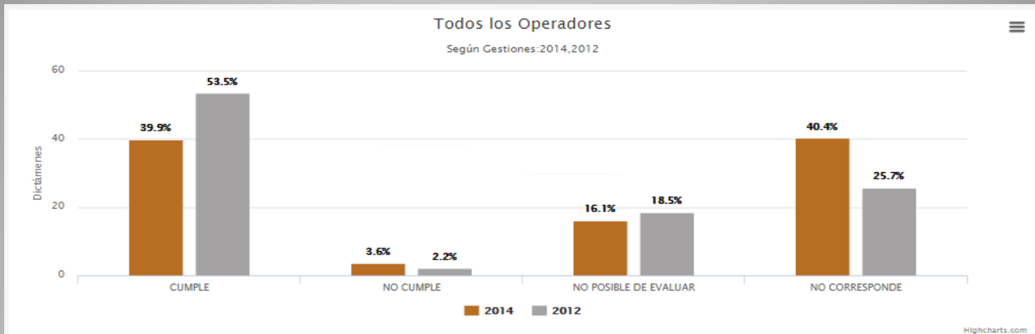
Todos los Operadores Gestión 2014